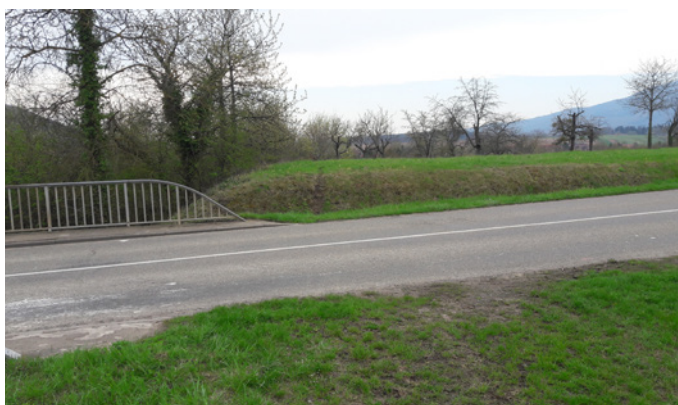
⤴ RD35 entre Rosheim et Boersch Risque de collision important avec la faune.

L' itinéraire « C » , le plus long des 3, permettra au hérisson d'éviter la traversée de la route en passant dessous. Par contre la suite du parcours sera moins évidente avec plusieurs champs qui viennent perturber la continuité des différents corridors.