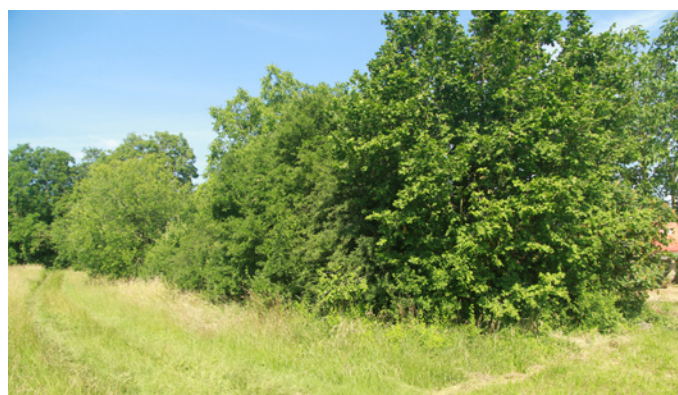
⤴ Haie pouvant servir de couloir de circulation pour notre hérisson.

Les haies, vergers et prairies qui jalonnent le parcours « A » permettront au hérisson de se déplacer en toute sécurité, de se cacher et de trouver à manger. Ces milieux favorables aux déplacements des espèces sont appelés « corridors écologiques ». Néanmoins les deux routes à traverser constituent des pièges mortels pour cet animal qui se déplace lentement et la nuit.