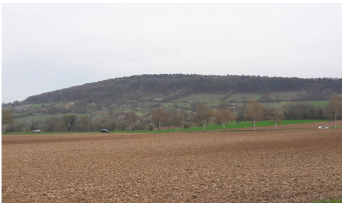
⌚ 12 avril 2018 - Champ nu Milieu défavorable au déplacement du hérisson

L'itinéraire « B » , le plus direct, traverse plusieurs surfaces importantes de champs qui seront nus à certaines périodes de l'année. Le hérisson ne pourra se mettre à couvert et risque de se faire attraper par l'un de ses prédateurs. Les deux routes traversées renforcent la dangerosité de cet itinéraire.