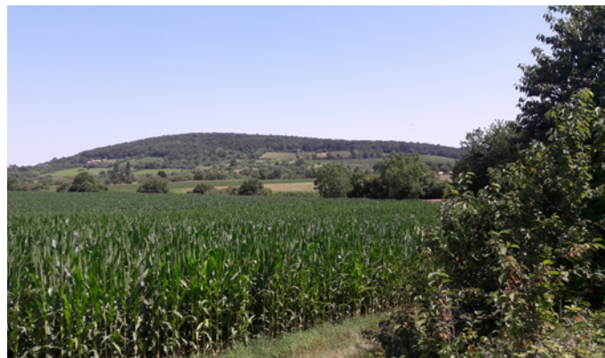
⌚ 02 juillet 2018 - Champ de maïs Peu de nourriture disponible pour le hérisson