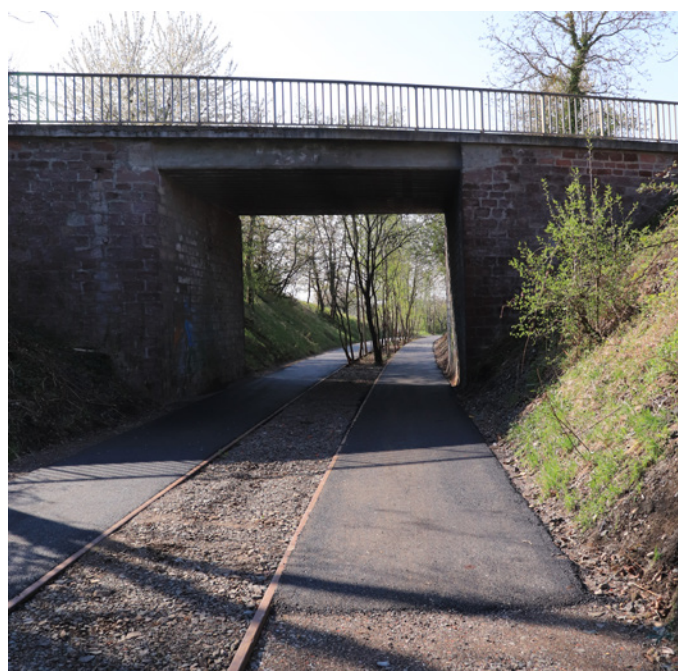
⤴ Passage possible de la faune sous le tunnel de la voie verte pour éviter de traverser la RD35 (11 avril 2019)