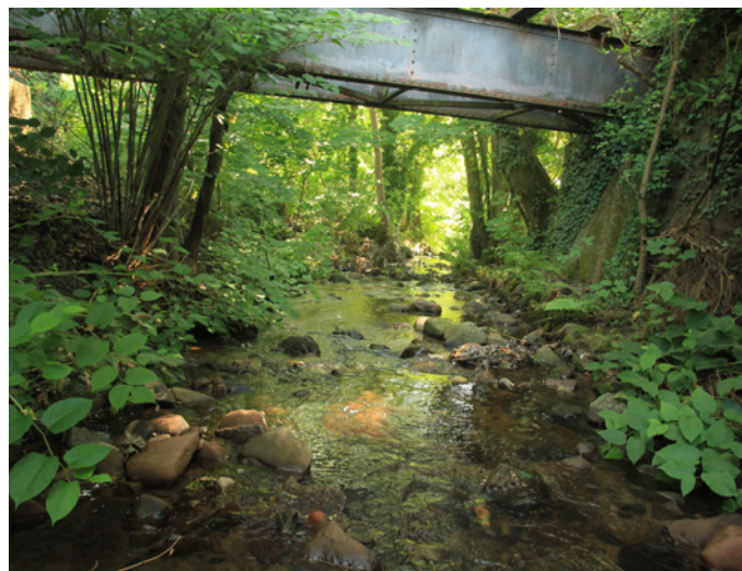
⌚ Sous vos pieds coule une rivière – 24 juillet 2018

Voici 3 espèces clés qui caractérisent un milieu aquatique de très bonne qualité !