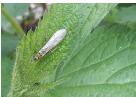
⌚ Perle adulte (2 cm) – 29 avril 2019

Voici 3 espèces clés qui caractérisent un milieu aquatique de très bonne qualité !